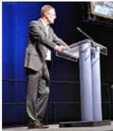
YS lederen om sykefraværet