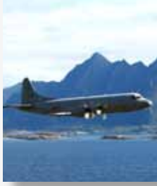
Ingerid i farta